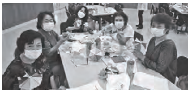
参加者同士で楽しくコミュニケーション♪