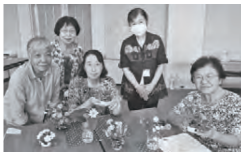
素敵なアレンジメントができました*