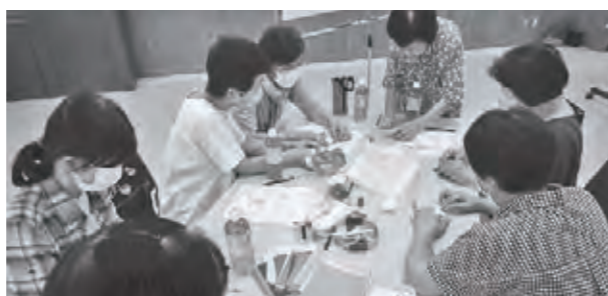
真剣に折り紙を折っていました

「難しかったけど、頭と心の体操になりました」や「認知症の母と共につくります」等の、感想をいただきました。