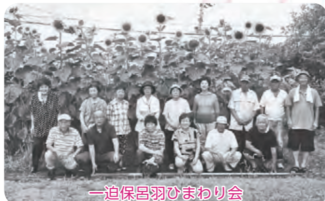
一迫保呂羽ひまわり会