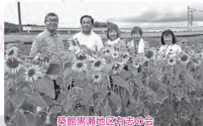
築館黒瀬地区有志の会