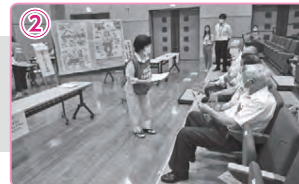
被災者からの依頼内容とボランティアをつなぎます。