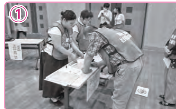
ボランティアの受付・保険加入を行います。