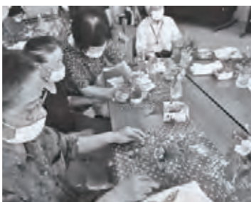
どの角度からみても