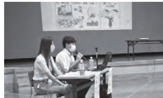
実際の映像を交えて、災害ボランティアセンターの役割と活動についてお話しいただきました。

災害時におけるボランティア活動は、被災時の復旧・復興、被災者の支援に欠かせないものになっています。そこで、市内ボランティア団体等を対象に災害ボランティア研修会を開催しました。初めにみやぎボランティア総合センター(宮城県社会福祉協議会)職員より「災害ボランティアセンターについて」講話をいただきました。後半は、大規模地震を想定し、災害ボランティアセンターの一連の動きを、運営スタッフ役とボランティア役に分かれて体験しました。