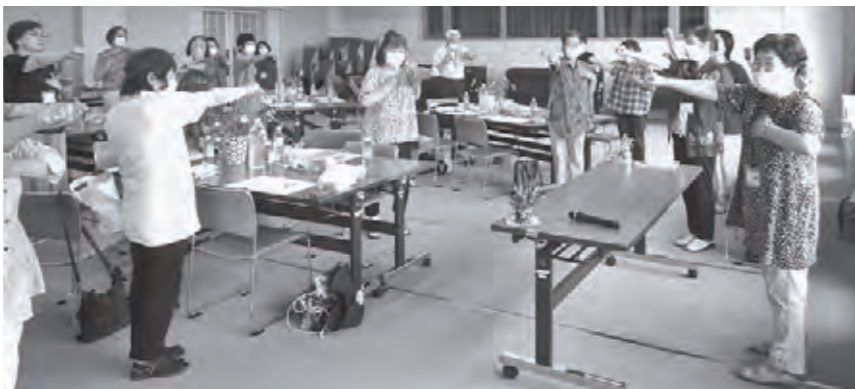
軽い運動をしてから、スタート

参加者同士お互いに作品を褒め合ったり、素敵なアイデアを自分の作品に活かしたりしていました。「敬老会の会場に作って飾ります」等の、うれしい声をいただきました。