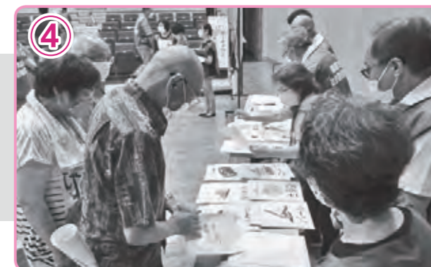
活動に必要な資材を貸出し、ボランティアを送り出します。