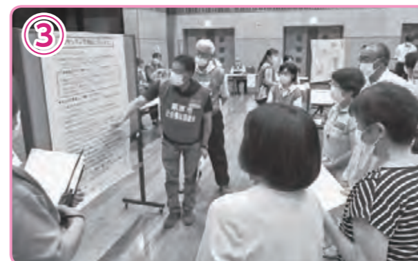
活動に行く前の注意事項を説明します。