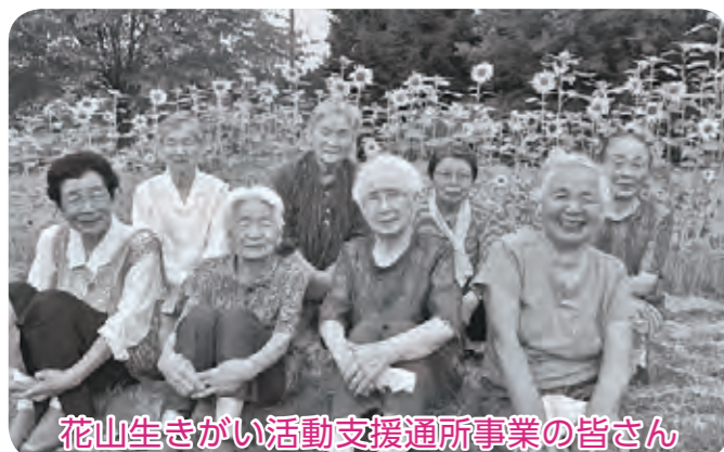
花山生きがい活動支援通所事業の皆さん