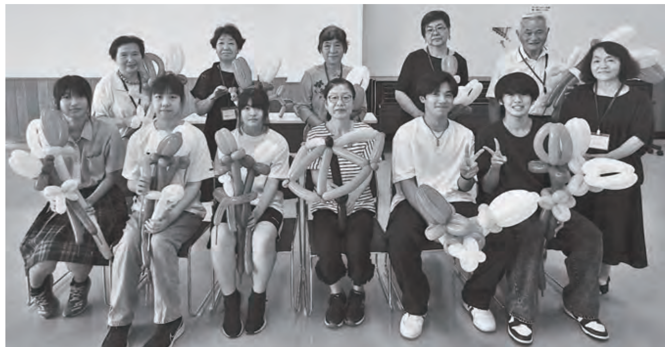
あっという間の楽しい時間でした♪

参加者全員が初めての体験ということで、基本の「イヌ」や「三色のチューリップブーケ」「とびねずみ」を作成しました。