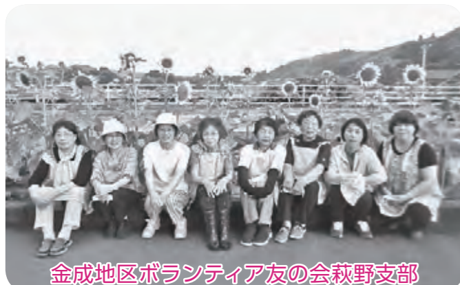
金成地区ボランティア友の会萩野支部