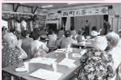
上手な踊りと楽しい時間♪