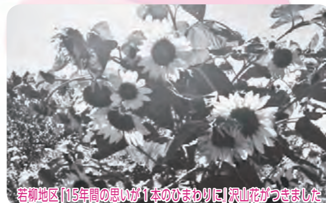
若柳地区「15年間の思いが1本のひまわりに」沢山花がつかました