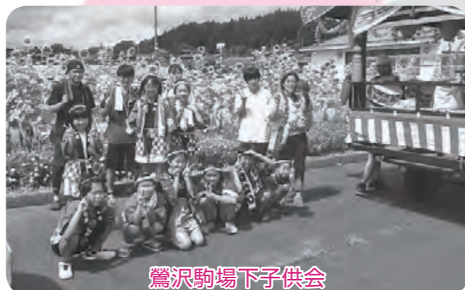
鶯沢駒場下子供会