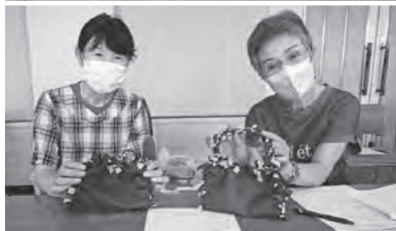
素敵なカバンが出来上がりました！