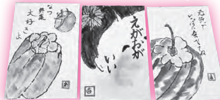
表情豊かな絵てがみが描けました！

絵てがみは「ヘタでいい」、「ヘタがいい」を合言葉に、絵てがみの基本の描き方を教えていただきました。参加者の皆さんは、ちょっぴり緊張しながらも季節の花や野菜などを手に、思い思いに描いていました。そして、完成した絵てがみに講師から一人ひとり講評をいただくと、笑顔がこぼれていました。和やかな雰囲気の中、充実した講座となりました。