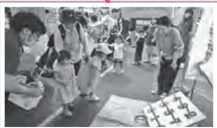
1番をねらって!それ~!

8月31日(土)に開催された2024栗原市民まつりでは、誰でも楽しめる「輪投げ」「ストラックアウト」「魚釣り」の3つのコーナーを設けました。大勢の親子連れが足を運び、子どもから大人まで楽しい時間を過ごしていただきました。また、今回は、Instagramで社協に関するクイズを投稿し、多くの方に参加いただきました。社協事業についてのお知らせなどを随時投稿しますので、ぜひ、ご覧ください。