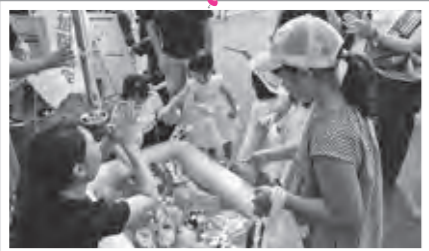
かわいい魚がたくさんいるよ!!