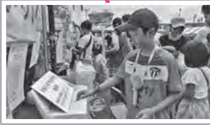
能登半島地震災害義援金・7月大雨災害義援金にたくさんのご協力をいただきました。

8月31日(土)に開催された2024栗原市民まつりでは、誰でも楽しめる「輪投げ」「ストラックアウト」「魚釣り」の3つのコーナーを設けました。大勢の親子連れが足を運び、子どもから大人まで楽しい時間を過ごしていただきました。また、今回は、Instagramで社協に関するクイズを投稿し、多くの方に参加いただきました。社協事業についてのお知らせなどを随時投稿しますので、ぜひ、ご覧ください。