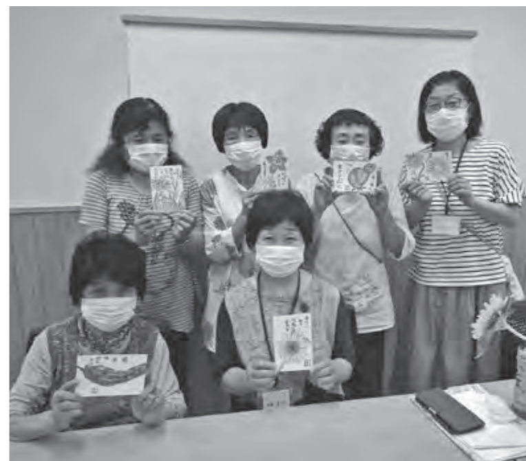
心を込めて描きました。「誰かに送ってみようかなあ」