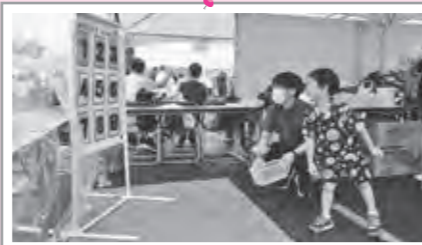
野球選手も夢じゃない!!みんな上手!