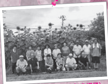
一迫ひまわり開花 (昨年の様子)