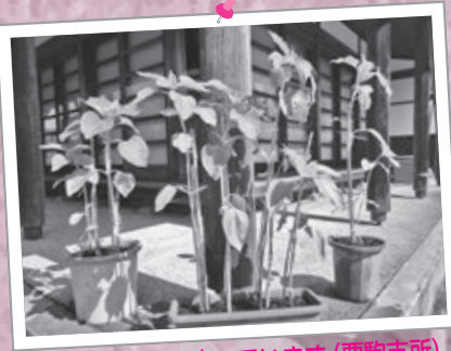
こんなに大きく育っています (栗駒支所)