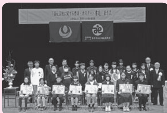
「福祉活動に関する標語・ポスター・書道」表彰式