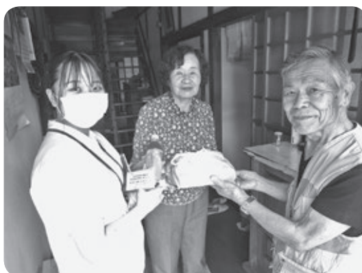
配食型食事サービス