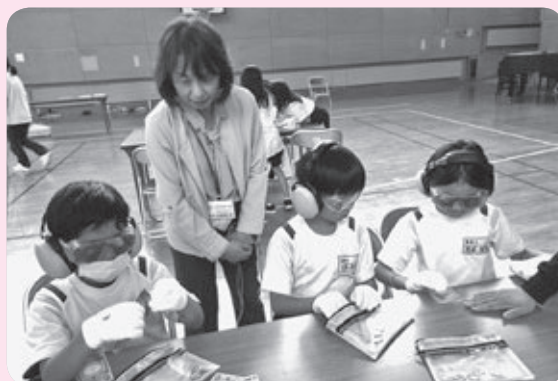
キャップハンディ体験