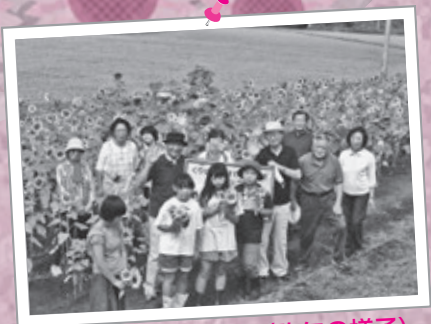
高清水ひまわり開花 (昨年の様子)