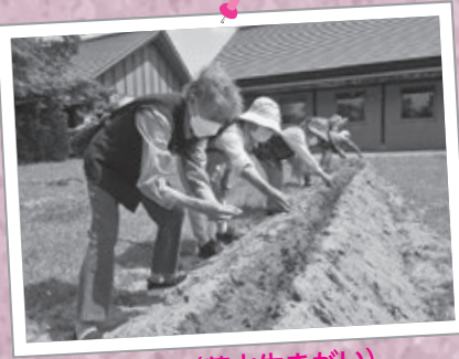
種まき (花山生きがい)