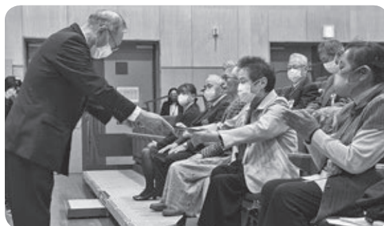
社会福祉功労者 表彰式