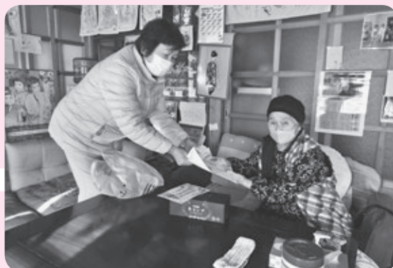
地域支援事業(歳末見守りひと声運動)