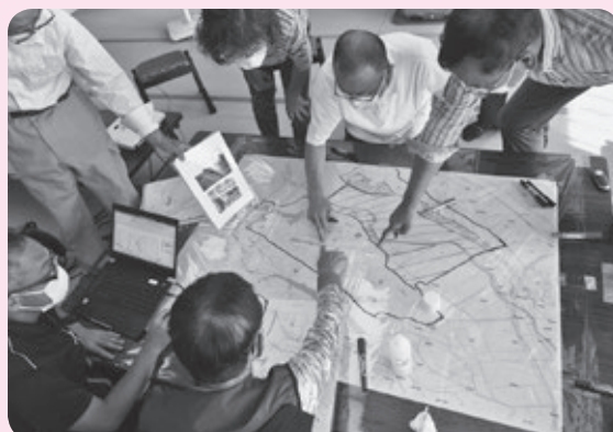
福祉防災まっぷ作成事業