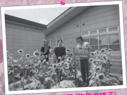
瀬峰ひまわり開花 (昨年の様子)