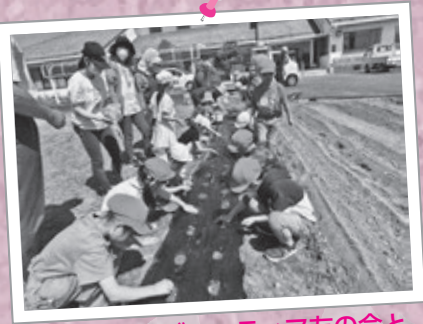
種まき (鷺沢ボランティア友の会と鷺沢小学校の子供達)