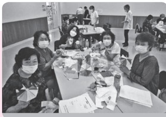
技術養成ボランティアスクール