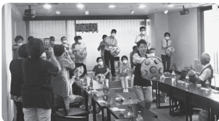
しあわせな地域づくり事業活動団体