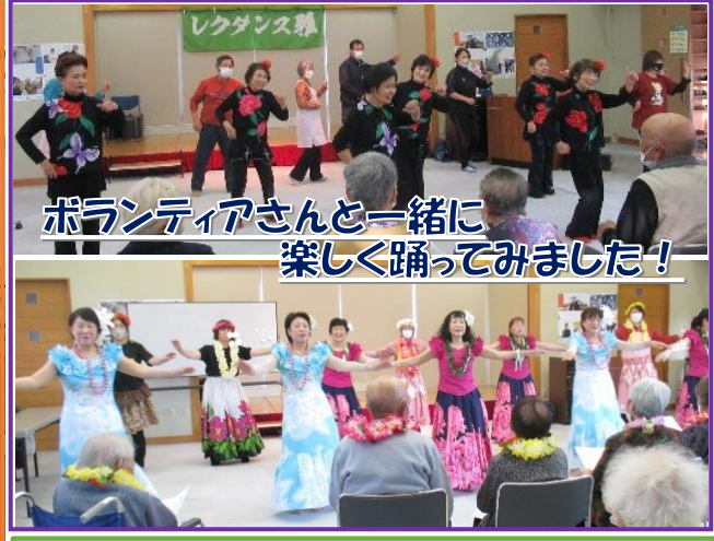
ボランティアさんと一緒に楽しく踊ってみました!