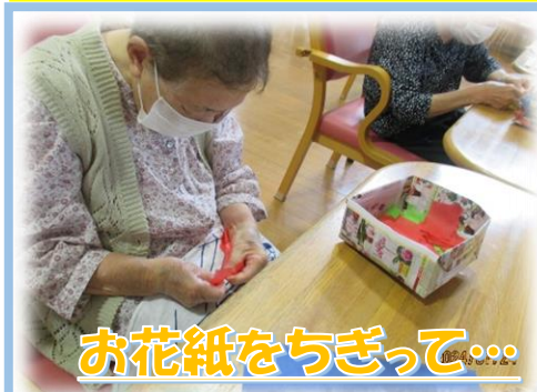
お花紙をちぎって...

一人ひとりの思いを込めて短冊を書きました。可愛らしい七夕飾り、ありがとうございました。