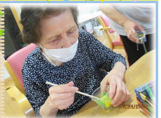
割り箸をつかって...

風鈴作りをしました。お花紙を貼る作業に苦戦しながらも、素敵な風鈴が完成しました。