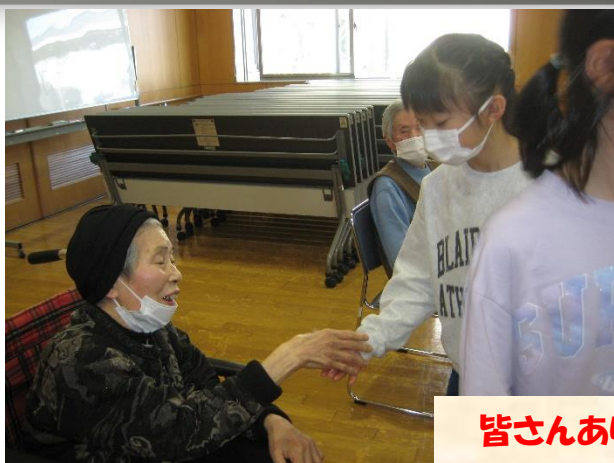
皆さんありがとう！