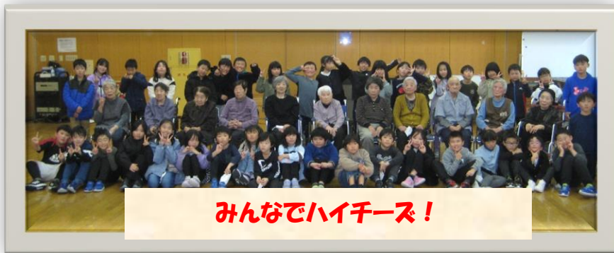
みんなでハイチーズ！