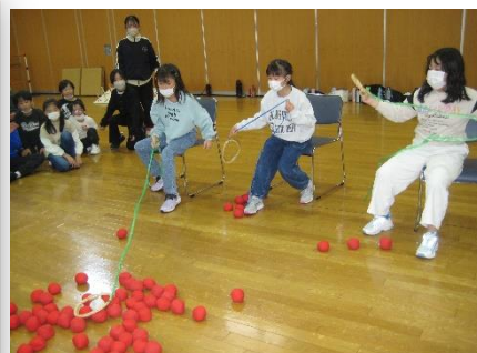
初めてのレクに大興奮！