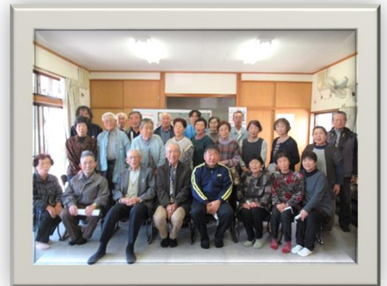
末野の皆様と記念写真！

地域のお茶っご会で、出前講座をさせて頂きました！！ 健康講話、体操、レクリエーション等、ご一緒させて頂きとても楽しい時間を共有させて 頂きました！お声かけあればお手伝いさせていただきますので、よろしくお願ひします！