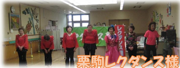
栗駒レクダンス様

3月は多くのボランティア様に来ていただき、デイを盛り上げていただきました！！ 毎回、様々な演奏や舞踊、ダンス等を披露して頂き、楽しい時間を過ごしております。 今後ともどうぞよろしくお願いたします！