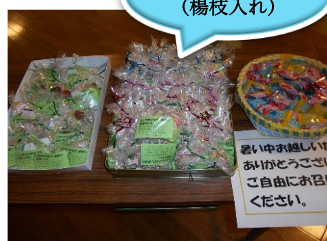
おみやげ (楊枝入れ)