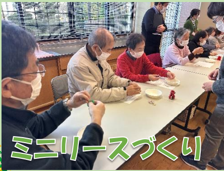
ミニリースづくり