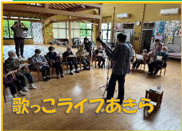
歌っこライブあきら