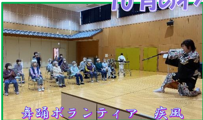
舞踊ボランティア 疾風