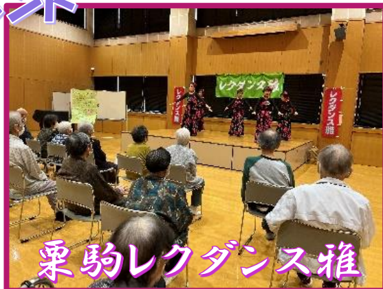
栗駒レクダンス雅