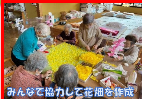
みんなで協力して花畑を作成