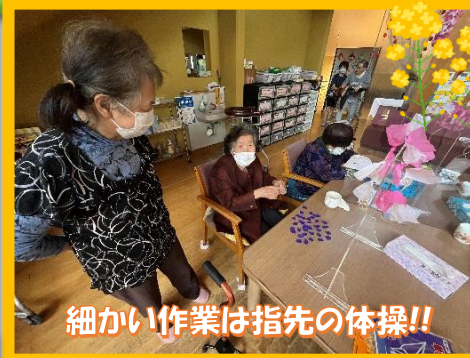
細かい作業は指先の体操!!