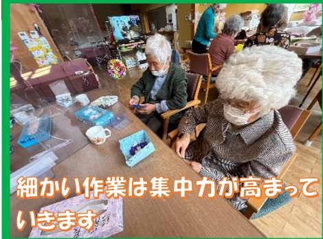
細かい作業は集中力が高まっていきます