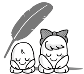
せみね薬局 様 さくら薬局 様