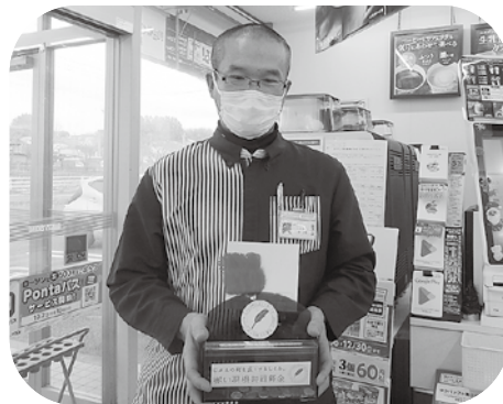
ローソン瀬峰店 様