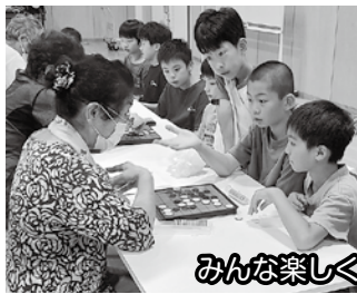
みんな楽しく交流しました