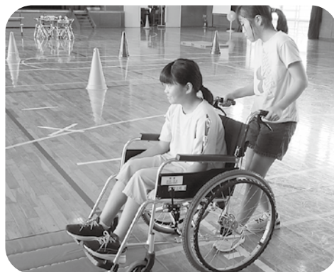
市内の小中学校で取組まれている「キャップハンディ体験」

ご協力いただきました「赤い羽根共同募金」は全額宮城県共同募金会へ送金し、令和7年度の福祉施設やボランティア団体・福祉団体・社会福祉協議会等の事業への配分、災害支援に役立てられます。