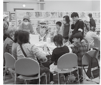
大にぎわいの『朝ごはん食堂』コーナー