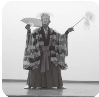
鶯沢神楽保存会の神楽