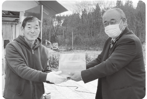
鶯沢放課後児童クラブの子ども達の手作りメッセージカードを添えて♪