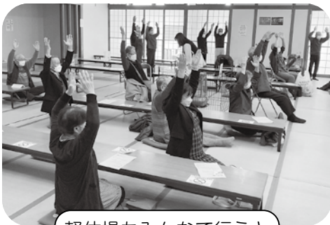
軽体操もみんなでやると気持ちがいいですね！

ひとり暮らし高齢者の方などを対象に、金成延年閣で神楽鑑賞や鶯沢小学校の活動の様子を映像で楽しむ交流会を開催しました。3年ぶりの開催に会場は大いに盛り上がり、楽しい時間となりました。