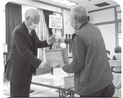
ドキドキ・ワクワクのお楽しみ抽選会も行いました！