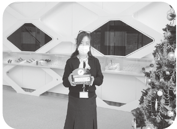
サンドビックツーリングサプライジャパン(株) 様