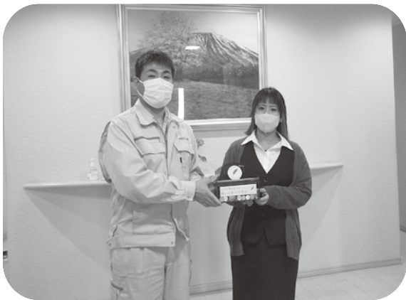
邦友電気工業(株) 様