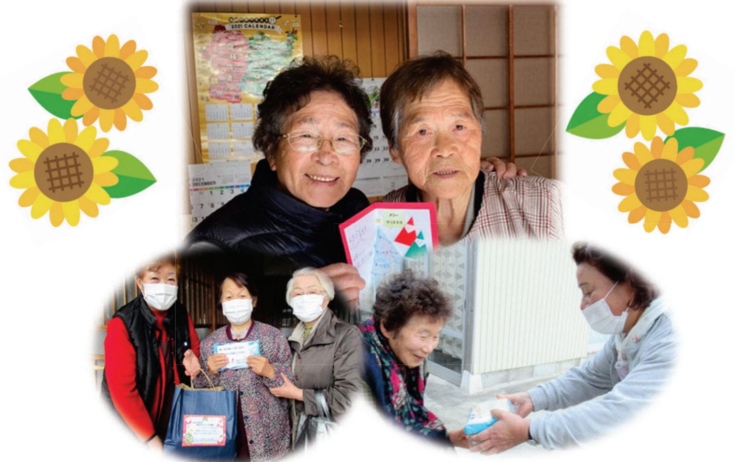
令和3年度 歳末見守りひと声運動の様子