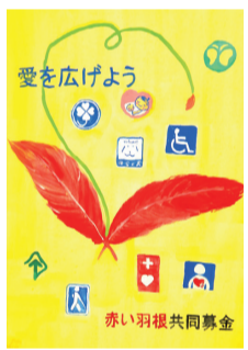
栗原南中3年 蜂屋 希歩