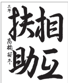
栗駒中3年 高橋 桜冬