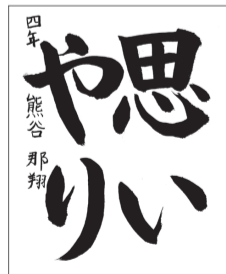
鷺沢小4年 熊谷 那翔