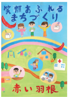
志波姫小5年 高橋 佳