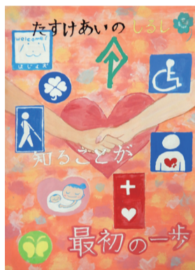
栗原南中1年 三嶋 花音