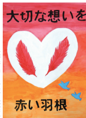
若柳小6年 清和 花音