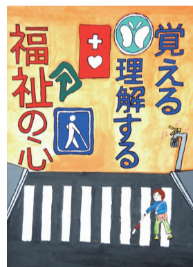
栗原南中2年 ケイパーハイパーカシ