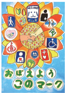
若柳小4年 菅原 愛以