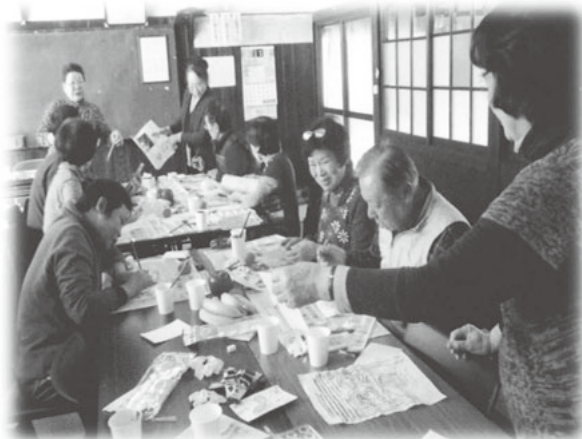
「絵手紙はヘタでいい・ヘタがいい」

1月23日(月)、若木集会所において、ふれあい餅つき大会を開催しました。 つきたての、温かいお餅をいただき、カラオケを楽しみながら有意義な交流会となりました。