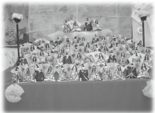
美しいひな人形が勢揃い

栗駒高齢者生きがい活動支援通所事業は毎週火・木・金曜日に開催して、季節の行事を取り入れ、様々な活動を行っています。3月は「ひな祭り」ということで、ひな人形制作をしました。個性豊かな、ひな人形が完成し、並べられ華やかになりました。