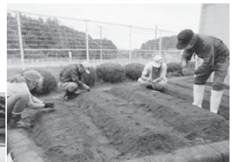
支部委員による種蒔き

高齢者の生きがい作りと社会参加を目的とした事業です。瀬峰保健センターを会場に、創作活動や軽体操のほか、講話を聞いたり、ボランティアさんとの交流などを行っています。活動日は毎週月曜日、みんなで楽しい時間を過ごしています。 ◆対象：60歳以上で要介護認定を受けていない方