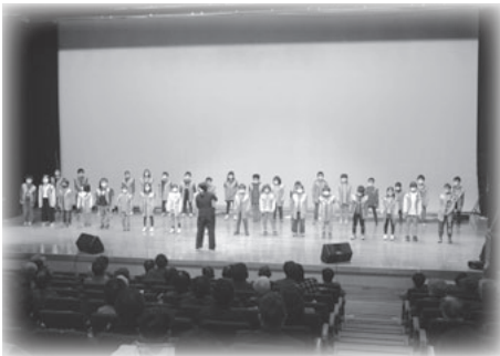
迫力ある一迫小の発表。