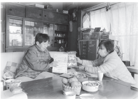
いつまでもお元気で!

今後も、つながりを大切に、誰もが安心して暮らしていける地域づくりを推進していきます。