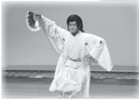
旭英会さんの見事な舞踊!