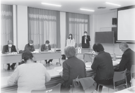
他の地域の活動を参考にすることも良いことです。

新型コロナウイルス感染症を正しく恐れ、出来る範囲の活動を継続していくこと。無理をして新たな取組みを作るより、これまで実践してきた活動をどのようにしたらコロナ禍でも継続できるか考えていく等の講話のまとめを受け、今後の地域福祉推進につながる研修となりました。