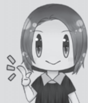
生活支援 コーディネーター

生活支援体制整備事業とは … 住み慣れた地域で元気に暮らし続けられるよう、住民主体の「支え合いの体制づくり」に取り組む事業です。