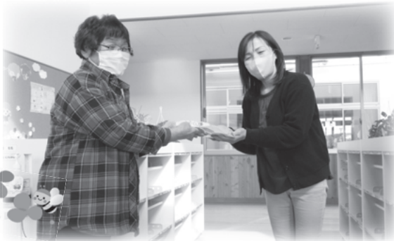
園長先生に代表してプレゼントを受け取っていただきました。

例年、栗原市社会福祉協議会栗駒支部で開催していた「栗原で育てよう!ちびっこ育成ミニ運動会」。コロナ禍により令和3年度も中止となり、代わりに栗駒幼稚園を訪問し、園児140名に玩具やマスクなどの記念品を贈呈しました。