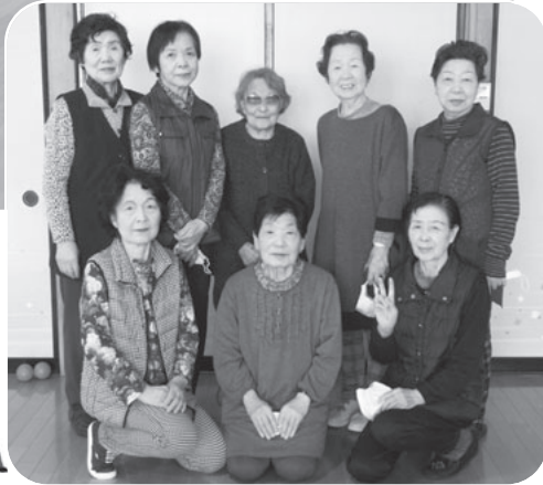
マスクを外した上で撮影しています。

スポーツ好きの老人クラブ会員が集まり、一週間に一回、室内ペタンクを楽しんでいます。スポーツで体を動かし、会話を交えながら一緒に楽しむことで心身ともにリフレッシュ。仲間と一緒に楽しむこの時間を大切に、これからもずっと続けていきたいと思います!! これが元気の源です!