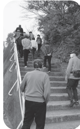
当日は天候にも恵まれました。

11月28日(日)、花山沢集会所において収穫祭を行いました。ゲーム大会としてスカットボール・スマイルボウリングの2種類のゲームを行いました。 昼食には、新米おにぎりの品種(①ひとめぼれ・②ササニシキ・③あきたこまち)当てを行い、アツアツの芋煮汁を食べました。 久しぶりに集まることができ、話も弾み楽しい交流の場になりました。 改めて地区内の交流で、話すことの大切さを感じた日になりました。