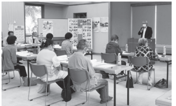
奉仕委員会議の様子