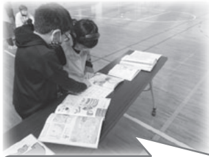
いつもの教科書の字、見える?