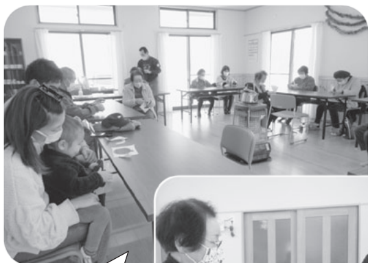
指先を使い脳の活性化!