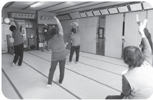
毎月の体操で筋力アップ!!