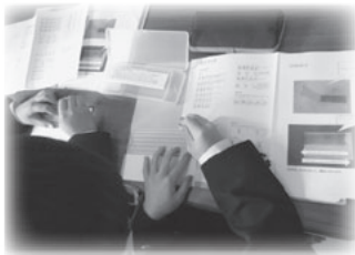
自分の名前を点字で打ちました。

障がい者の気持ちになり、大変さを理解し思いやりの気持ちを育む福祉体験となりました。