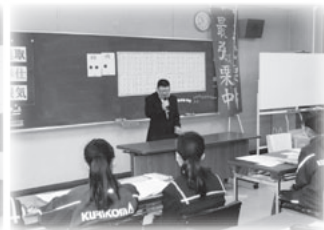
講話を真剣に聞いています。