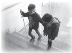
誘導の声掛けはしっかりと!

高齢者疑似体験では、ヘッドホンやゴーグルを装着し、音の聞こえにくさや体の動きの不自由さを実際に体験し、障がいを持った方や高齢者の不安や不便さについて理解を深めることができました。