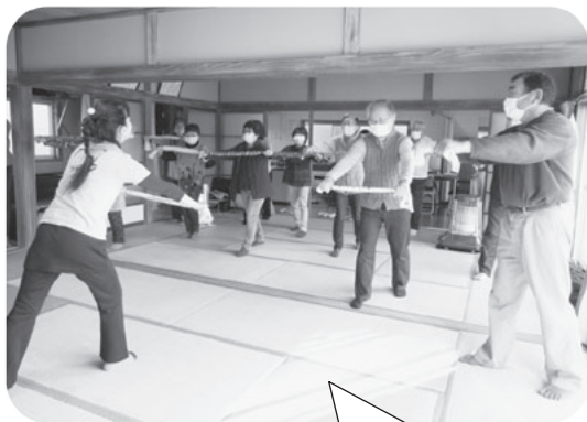
手拭いを使った体操で体を伸ばすとスッキリ!

12月6日(日)、川東集会所を会場に開催しました。生活支援体制整備事業について地域で理解を深め、健康体操を行いました。地区の方が中心となり、曲に合わせた体操や手拭いを使っての体操でコロナに負けない体作りに取り組みました。