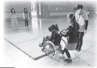
段差に気を付けて介助します。