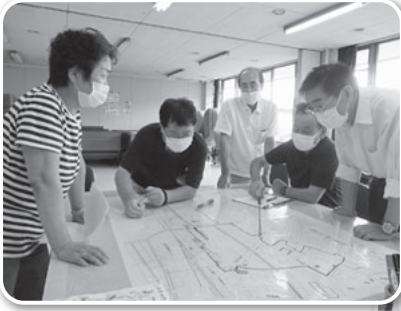
まっぷに情報を書き入れていきます。

まっぷ作成を通じ、改めて危険箇所を再確認し、防災への意識が高まる機会となりました。