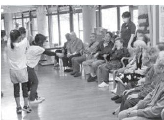
▲クイズに回答中の利用者さん!