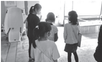
◀デイ浴室の見学の様子。 「うわあ ひろーい」と 興味深々でした。

6月26日(金)には、3 年生3人が、湖畔の里施 設見学・デイサービスセ ンター利用者との交流会 を行いました。