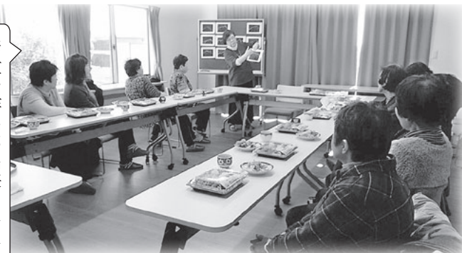
素敵な作品が出来ました