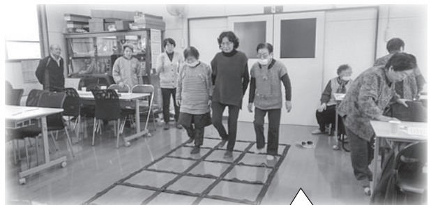
元気に参加出来るように頑張ろう

2月9日(日)、こうゆうセンターを会場に、お茶つこ会を開催しました。32名の参加者が集い、ラジオ体操や、健康・認知症予防のゲームをしたり、替え歌を歌ったりと楽しみました。その後、役員さんの手作りの昼食を食べながら、会話も弾み、笑顔が溢れる会となりました。