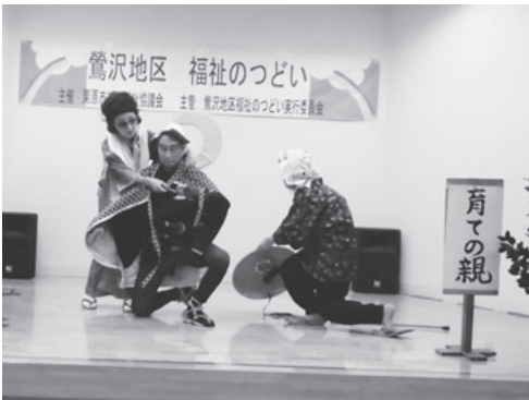
『瞼(まぶた)の母』 鶯沢地区ボランティア友の会

12月2日(月)、鶯沢老人福祉センターを会場に、令和最初となる「鶯沢地区福祉のつどい」を開催しました。77歳以上の一人暮らし、高齢者世帯の方々に招待し、実行委員を含め約130名が一堂に会しました。今年度は鶯沢小学校1、2年生児童に劇を披露してもらいました。子ども達の素晴らしい演技に会場内からは大きな拍手が贈られました。