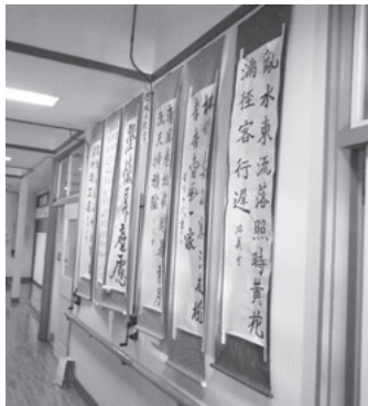
趣味の教室「書道教室」 生徒さんの作品

ステージ発表では、各地区から唄や踊りが披露されました。初めて、鶯沢地区ボランティア友の会と鶯沢老人福祉センター趣味の教室「だれでもピアノ教室」の先生と生徒さんによる演奏など趣向を凝らした演出もあり、大いに盛り上がりました。実行委員および、民生委員児童委員の皆さま、そして、このつどいの開催に際しましてご協力いただきました皆さまに感謝申し上げます。