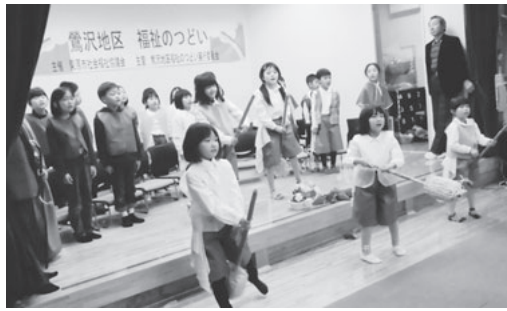
鶯沢小学校2学年『地球のこどもたちへ』