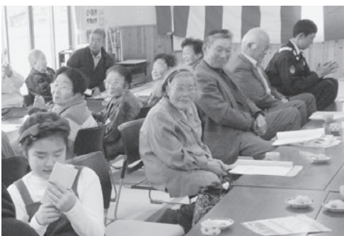
敬老作文に、みなさん 笑顔です(0)

ステージ発表では、各地区から唄や踊りが披露されました。初めて、鶯沢地区ボランティア友の会と鶯沢老人福祉センター趣味の教室「だれでもピアノ教室」の先生と生徒さんによる演奏など趣向を凝らした演出もあり、大いに盛り上がりました。実行委員および、民生委員児童委員の皆さま、そして、このつどいの開催に際しましてご協力いただきました皆さまに感謝申し上げます。