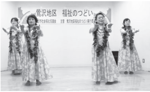
華やかに『ハナミズキ』♪