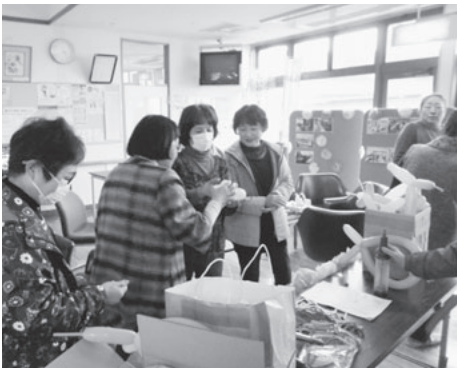
バルーンアート作成中! 実行委員のみなさん

12月2日(月)、鶯沢老人福祉センターを会場に、令和最初となる「鶯沢地区福祉のつどい」を開催しました。77歳以上の一人暮らし、高齢者世帯の方々に招待し、実行委員を含め約130名が一堂に会しました。今年度は鶯沢小学校1、2年生児童に劇を披露してもらいました。子ども達の素晴らしい演技に会場内からは大きな拍手が贈られました。