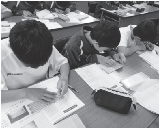
自分の名前を点字で打ちました。