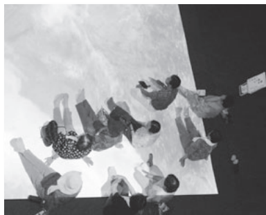
シアター見学の様子。

8月8日（木）、尾松地区・文字地区の高齢者を対象に、民生委員さんの協力をいただき、栗駒山麓ジオパークビジターセンターを見学しました。シアターでは栗原市の美しさに魅了され感動していました。その後、栗駒耕英地区「山脈ハウス」を会場に、会食をしながら交流会を楽しみました。