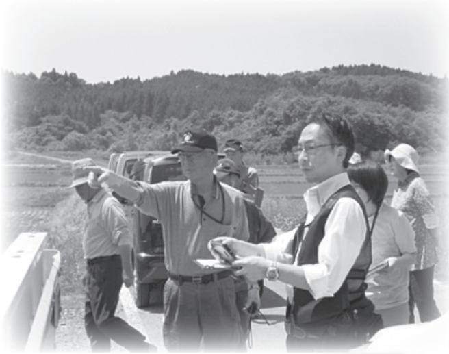
現地踏査 全員で同じルートを確認します

6月3日(日)、泉沢地区において防災まっぶ作成を行いました。地域を実際に歩いて回り、現地踏査し、平成27年度におきた水害の経験を踏まえ、意見を出し合いながら危険箇所等をまっぶに落とし込んでいきました。作成をしていく上で、新たな課題の解決に向けて地域住民同士、真剣に取り組む姿勢が印象的でした。