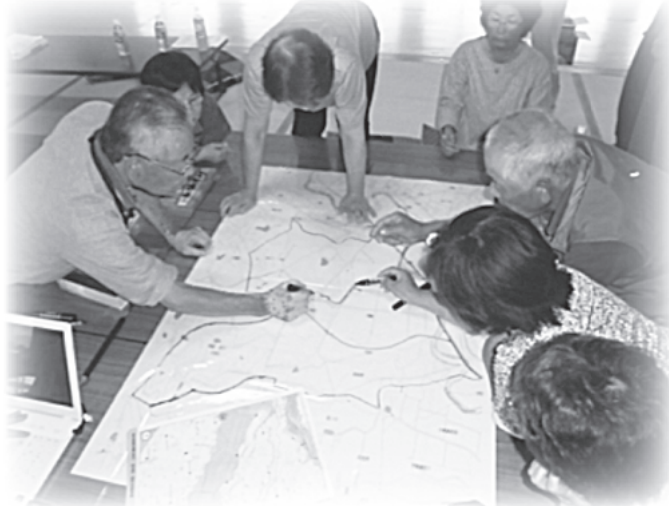
危険箇所を確認しながら地図に書き込みます