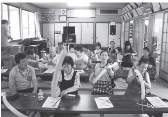
「さあ、皆で挑戦です」

6月30日(土)、清水田集会所を会場に、お茶つこ会を開催しました。栗原市社協の出席講座を利用し、バルーンアートに挑戦しました。 風船の割れる音に、びっくりしながらも犬や剣を作り童心へ返り夢中になった時間でした。