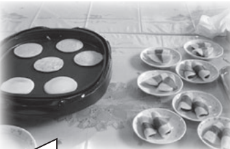
桜の香りがして美味しそうだね