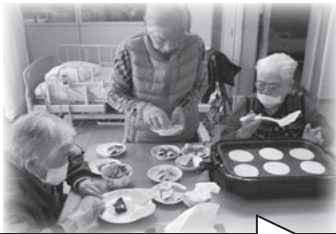
皆で手分けして作りました

今後も様々な行事を計画し、利用者の方々に喜んでいただけるよう、職員一同努めてまいります。