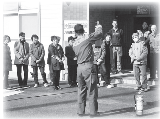
いざという時のために

11月18日(土)、八幡集落センターを会場に、お茶つこ会と防災訓練を開催しました。 栗原市社協の出前講座の健康体操、栗原消防署職員を講師に、消火器の使用方法や煙体験ハウスの使用法の避難方法の訓練を行い、皆さん真剣に取り組んでいました。