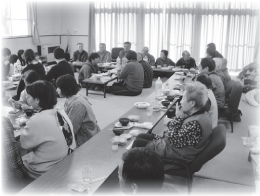
おいしいお餅に舌鼓

12月3日(日)、宝来の里を会場に、お茶つこ会を開催しました。 地区の子ども達と一緒に餅つきをし、美味しいお餅を食べながら会話に花が咲きました。 その後、ビンゴ大会で盛り上がり、賑やかな時間を過ごしました。