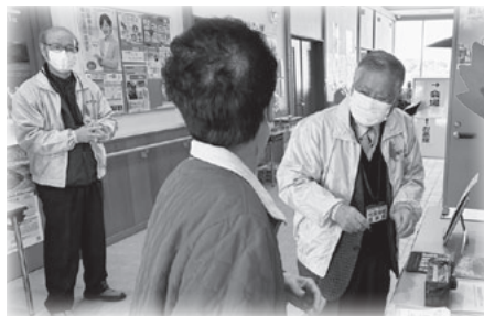
【赤い羽根共同募金】