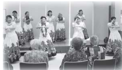
フラダンス ミノアカフラ様