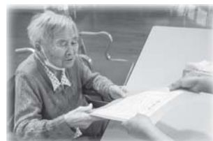
感謝状 どうもありがとう