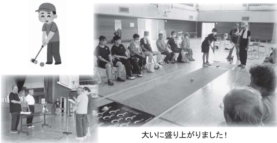
大いに盛り上がりました！