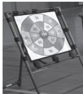
ターゲットゲーム

どれもルールは簡単。世代を問わず、みんなで楽しめます。汗を流して楽しく健康維持につなげませんか。地区行事等で利用してください。写真以外にも用具がありますので社協志波姫支所（おもと荘）までご連絡ください。