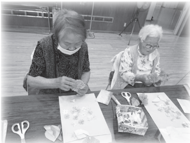
指先を使ってお花紙を丁寧に開き、紫陽花の花を作りました。

高齢者の生きがいづくりと社会参加を目的に、介護認定を受けていない60歳以上の方を対象として、毎週火・木曜日に活動しています。創作活動や軽体操、脳トレゲームでの交流、ボランテニアさんの訪問や講話など、季節ごとのお楽しみ会も開催し楽しい時間を過ごしています。