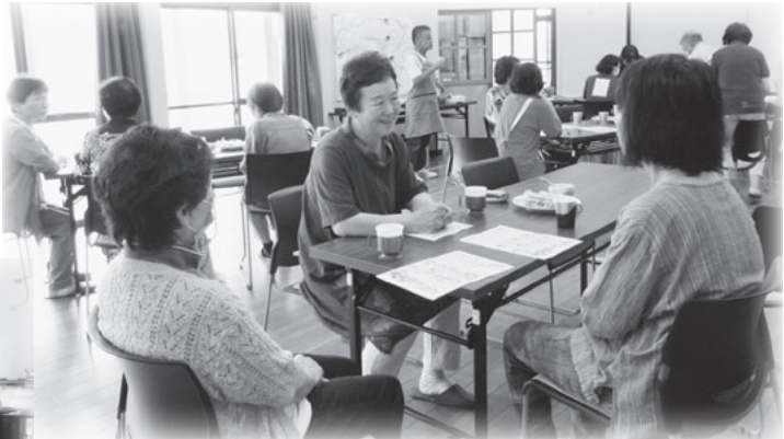
マスターは区長さん!心を込めてコーヒーを入れます。