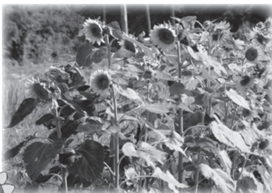
R5年度ひまわり開花の様子（有壁3地区内）