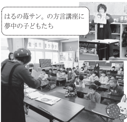
はるの苺サン。の方言講座に夢中の子もたち

終わりには、折り紙で作つた花束とアイロンビーズで作つたキーホルダーを子ども達から頂き、とても和やかな時間となりました。