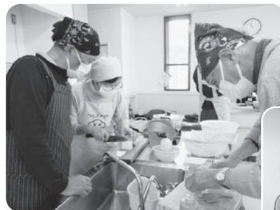
慣れた手つきで野菜の準備

栗駒鶯沢保健推進室の栄養士指導のもと「男の料理教室」を開催し、バランスの良い食事の摂り方などを学び、実際に料理を作りました。