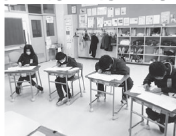
自分の名前を点字で打ちました。