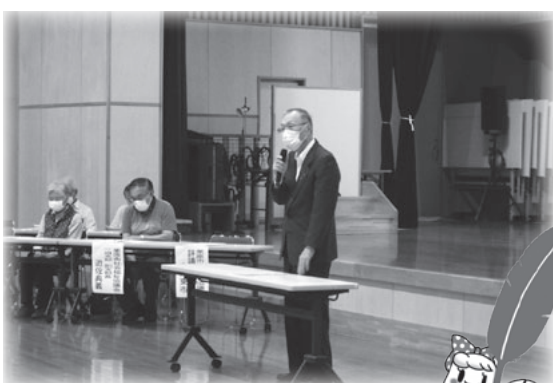
奉仕委員会議の様子

栗原市共同募金委員会では、各世帯への戸別募金、法人・学校募金、募金箱の設置を通じて募金をお願いしております。奉仕委員さんがご自宅を訪問した際にはあたたかいご協力をお願い申し上げます。