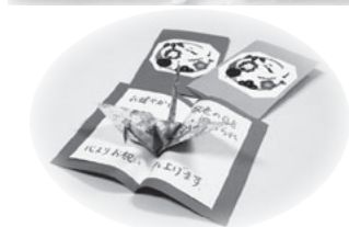
職員からのプレゼント