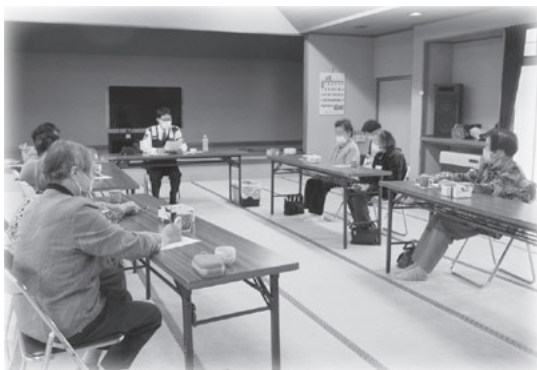
一迫駐在所の丁子所長より、交通安全についてとオレオレ詐欺についての講話を受けました。