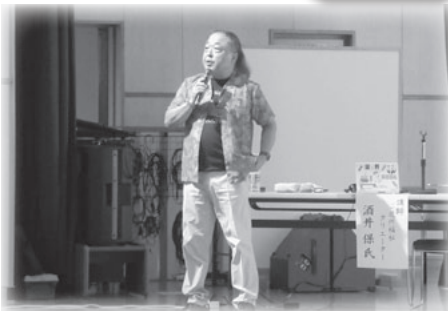
「出来ないこと」の支援ではなく、「出来ること」の応援をしましょう！