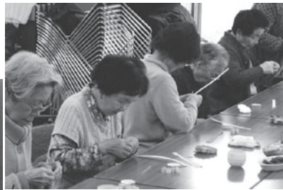
紙をくるくる巻くのも真剣です