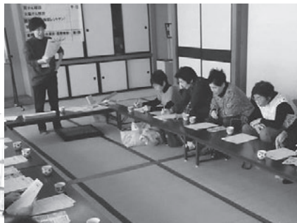
健診結果 よく見てこれからの健康づくりに活かしましょう。

北郷公民館において、ニコニコクラブと共催の健康教室を行い、20名の参加がありました。栗駒・鶯沢保健推進室より講話「健診結果を活用しよう」を聞いた後はスマイルボウリングを行い、元気いっぱいの一日となりました。