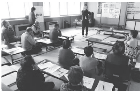
よーく、マッサージをして…唾液が溜まってきましたか?

会場には手作りのおひなさまを飾り、昼食にはちらしずしをいただき、季節感たっぷりに楽しむことができました。