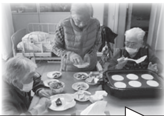
皆で手分けして作りました

今後も様々な行事を計画し、利用者の皆さんに喜んでいただけるよう、職員一同努めてまいります。