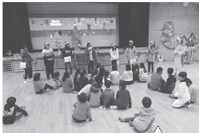
次のゲームは勝つぞ!

参加した子ども達は、すぐにジュニアリーダーに打ち解け、楽しい時間を過ごしました。