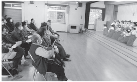
「瀬峰幼稚園児のお遊戯鑑賞」