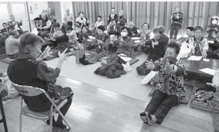
「元気にゲー・チョコキ・パー!」