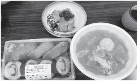
「瀬峰の南瓜は美味しい!」と大好評

12月5日（火）、「第2回お食事会」を開催し、65歳以上の一人暮らしの方や民生委員さん等、総勢45名に参加いただきました。 第一部では、瀬峰幼稚園の皆さんのお遊戯を観賞し、昼食には、とん汁や瀬峰の南瓜を使った冬至南瓜を味わっていただきました。 第二部では、お正月飾りの制作や健康体操、ビンゴゲームで和気あいあいと過ごしました。たくさんの人達とふれ合い、心も身体も温まり、笑顔あふれるお食事会となりました。