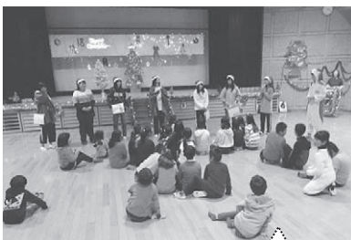
次のゲームは勝つぞ!

参加した子ども達は、すぐにジュニアリーダーに打ち解け、楽しい時間を過ごしました。