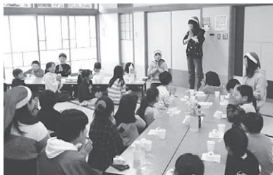
ケーキの前の感謝の言葉