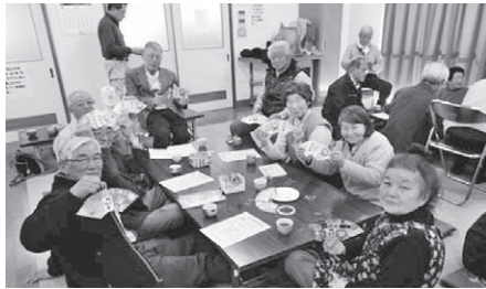
「お正月飾りの完成です」