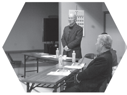
「年末おたすけ隊事業」は安否確認の一環として行っています。