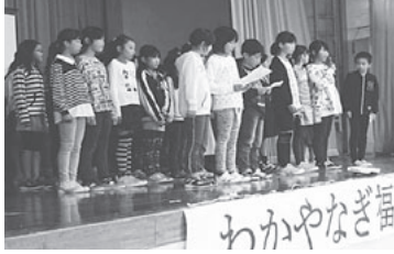
小学生の「夢の発表」に大きな拍手