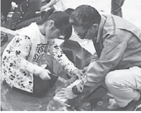
大工体験にチャレンジ