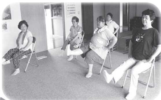
「はい、声を出して！ 1. 2. 3. 4…」

DVDを見ながら皆で体操した後はお茶を飲んだり、情報交換をしたりと、楽しみながら活動しています。