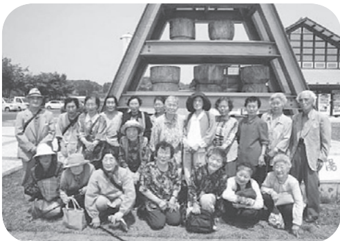
外出行事 道の駅厳美溪にて

健康チェックを行い、軽体操や歌、創作活動やボランティアさんによるアトラクション等盛りだくさんの内容です。また、外出行事や、温泉保養等も行っています。興味のある方はお問い合わせください。(☎42-1248)