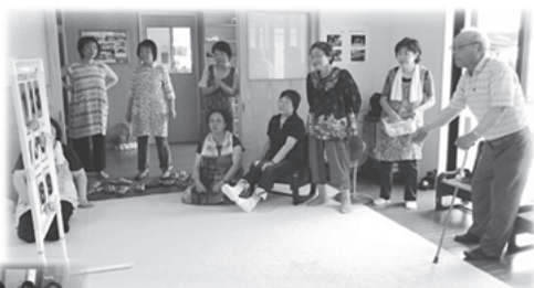
「ストライクナイン 高得点が出ました！」