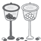
「玉入れゲーム・タオルでポン」

ゲームで身体をリフレッシュした後、委員さん手作りの食事を頂き、年1回の交流を楽しみました。参加者からは、「来年もぜひ参加したいです。」という声が多くありました。