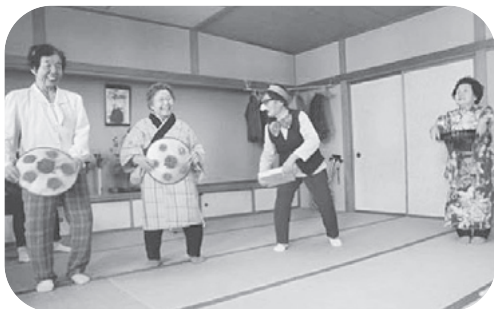
お楽しみ会の様子