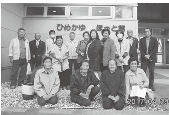
思い出に残る有意義な一日となりました。

これからも、地域でコミュニケーションを図りながら、いきいきと生活をしていきたいと思えます。