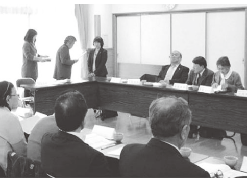
「どうぞ、よろしくお願いいたします！」