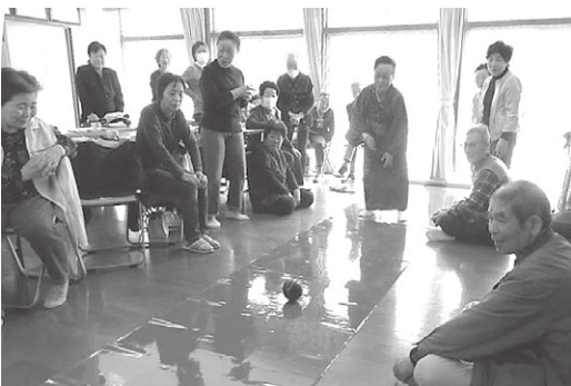
「ストライクをねらって、それ〜。」

楽笑会の活動が、安否確認につながる事に気づき、福祉委員の活動の大切さを実感しました。