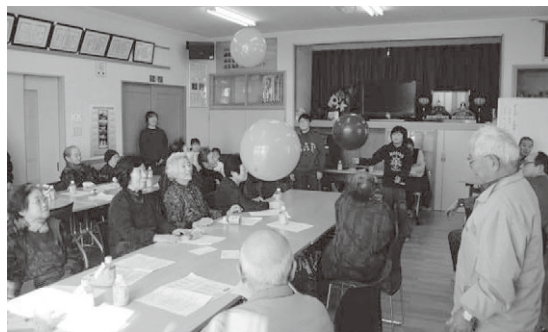
子ども達との風船バレーの様子

3 月 10 日(金)、里谷生活センターにおいて、防災のつどいを開催しました。 栗原市消防署北分署より講師を招き、消火器の使い方等の指導をいただきました。防災意識の向上を高める良い時間となりました。