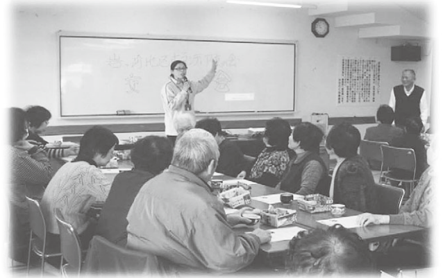
包括支援センター職員による講話の様子

4月4日(火)、みちのく伝創館において、ひとり暮らし高齢者と友の会会員との交流会を兼ねた研修会を開催しました。