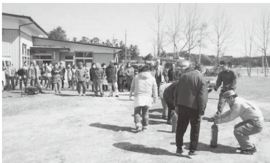
消火器使用指導の様子